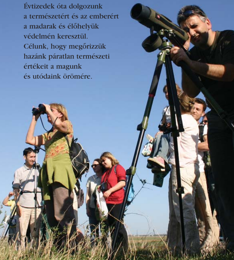
Illusztráció: Matyikó Tibor

Évtizedek óta dolgozunk a természetért és az emberért a madarak és élőhelyük védelmének érdekében. Célunk, hogy megőrizzük hazánk páratlan természeti értékeit a magunk és utódaink örömeire.